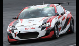
スーパー耐久レースで実証されたエアロダイナミクス

●設定/86 (Z/N6) H24年2月以降、リヤバンパー "Racing" 装着車専用