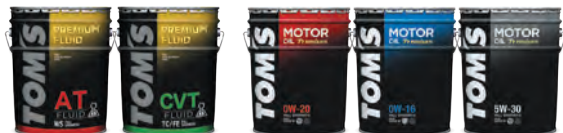
ATF / CVTF