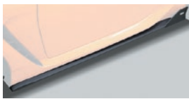
02 サイドディフューザー

保安基準適合 1.5H 2.5H 素材: FRP製 地上高: 約30mm ダウン 全長: 約25mm プラス