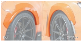
08 オーバーフェンダー