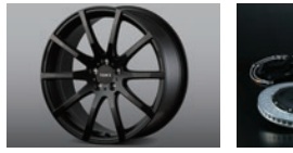
09 アルミホイール [TWF04]

アルミ鍛造ワンピース TPWS 対応 カラー: フラットブラック サイズ: 18インチ 18x8.0J +45 5H/100 2023年9月発売予定