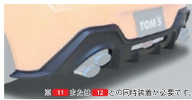
03 リアアンダーディフューザー

保安基準適合 3.0H 4.0H 素材: FRP製 地上高: 約30mm ダウン