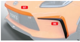
06 フロントバンパーガーニッシュ