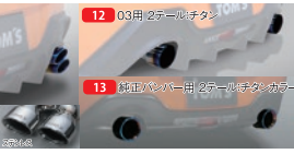
エキゾーストシステム [トムス・バレル] [交換マフラー事前認証制度対応品] 1.0H

モノブロックキャリパー 大径リドルブレーキローター ステンレスメッシュホース 低ダストブレーキパッド付属 ※純正ホイール装着不可