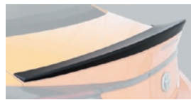
05 トランクリッドスポイラー

保安基準適合 1.0H 2.0H 素材: ABS製 地上高: 約27mm ダウン