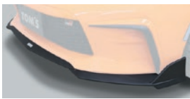
01 フロントディフューザー

保安基準適合 1.5H 2.5H 素材: FRP製 地上高: 約30mm ダウン 全長: 約25mm プラス