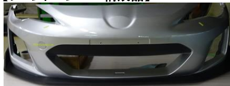
①フロントバンパー